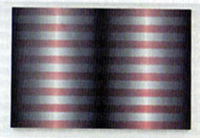
LINDA ARTS, 'ZONDER TITEL # 180', 120 X 180 CM '08. OLIEVERF EN LAKKEN OP PANEEL.

In twee Antwerpse galleries is werk te zien van evenveel sterk uiteenlopende kunstenaars, met toch een gemeenschappelijk kenmerk: de illusie van de derde dimensie, opgeroepen in tweedimensionaal werk. Bij galerie Kusseneers toont de Duitse kunstenaar Wolfram Ullrich strak geometrisch werk dat, door het gebruik van vluchlijnen en perspectivistische illusie, van de muren lijkt weg te schieten. Ullrich maakt zijn modellen eerst in drie dimensies, om ze daarna om te zetten in een tweedimensionaal werk. Het gebruik van specifieke kleuren zorgt, samen met de vluchlijnen, voor het ruimtelijk effect. Een verrassende ervaring, ook voor doorgewinterde kunstliefhebbers.