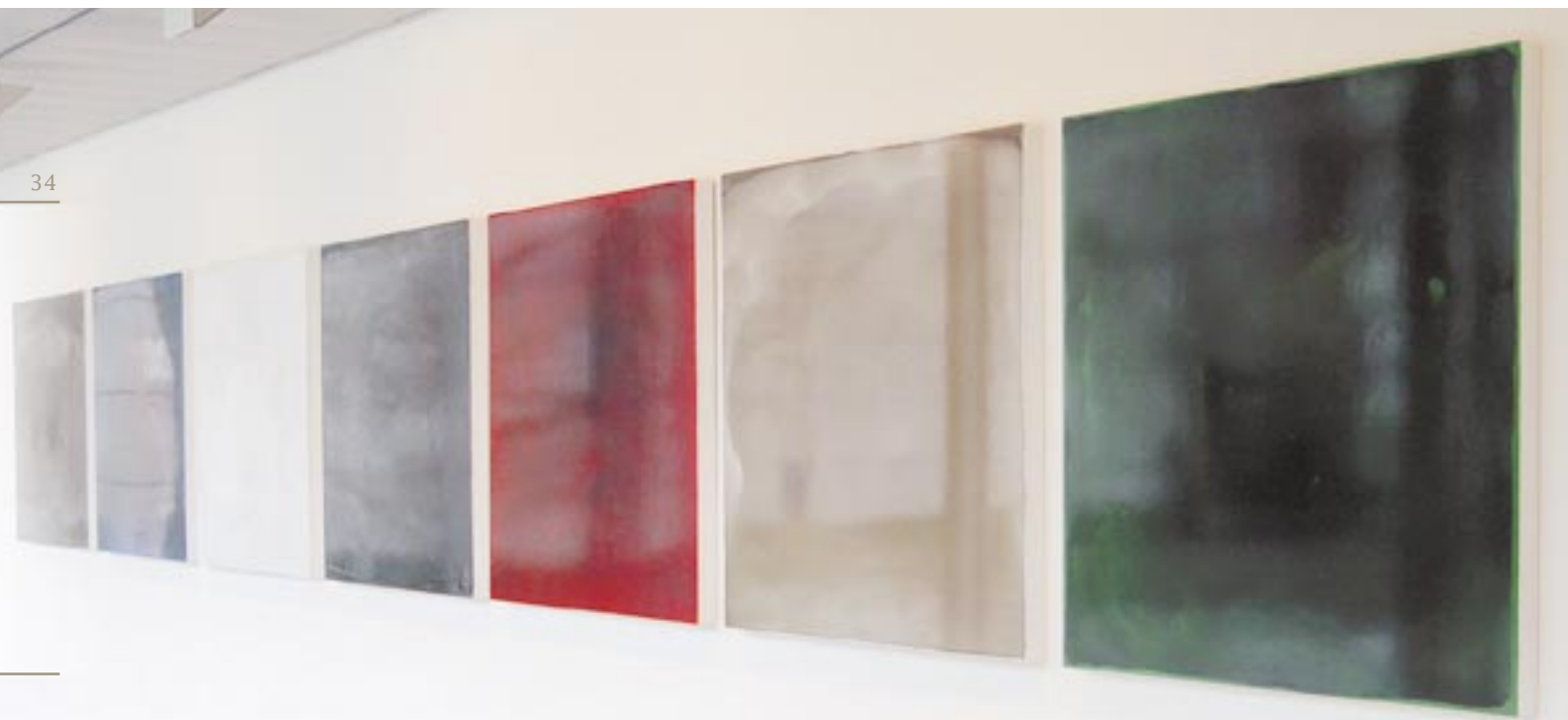
Tentoonstelling Noordbrabants Museum, Den Bosch

van de vakken, net als grafische vormgeving. In de loop van deze opleiding begon ik ook bewuster vakken te kiezen die gericht waren op de kunstacademie. De stap naar de Academie voor Beeldende Vorming in Tilburg was na Arnhem dan ook een logische.